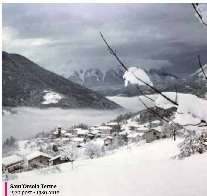
Sant'Orsola Terme 1970 post - 1980 ante

Il Vice Presidente della Comunità di Valle